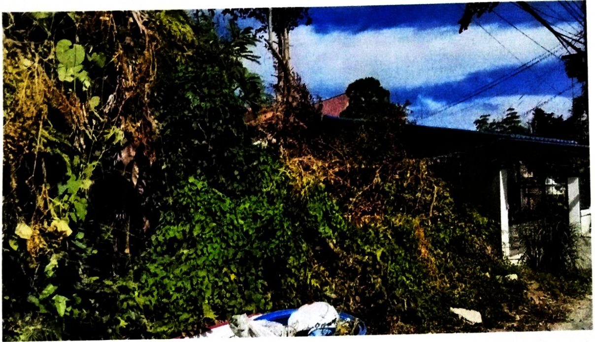
รูปภาพประกอบการลงพื้นที่ตรวจสอบเรื่องร้องเรียน/ร้องทุกข์